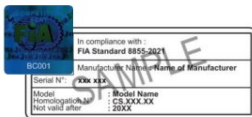
Fig.1. Modèle d'étiquette